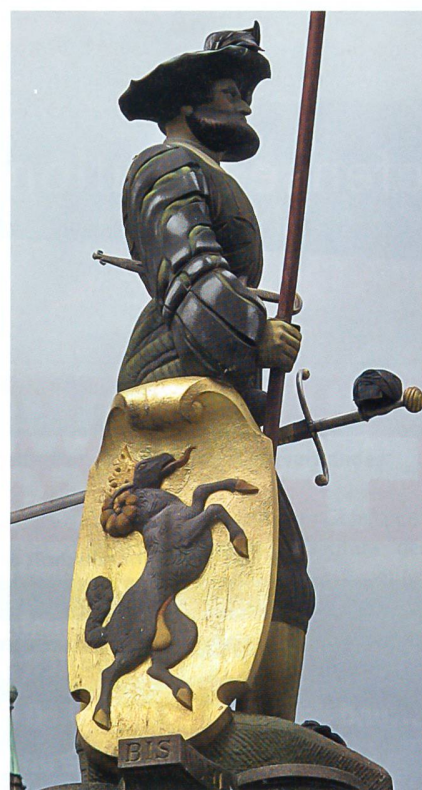
Seit Jahrhunderten überragt der Landsknecht den Schaffhauser Fronwagplatz.