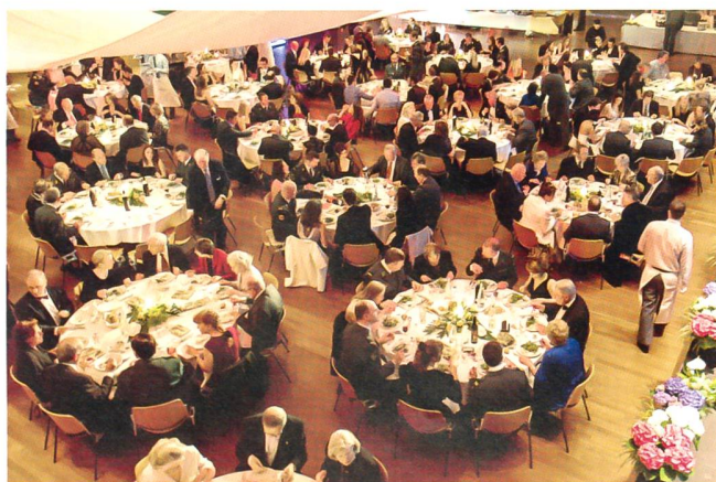
Wie stets am Anlass der OG Waadt, der den Namen trägt: Officers du Coeur , war der Festsaal prächtig hergerichtet.