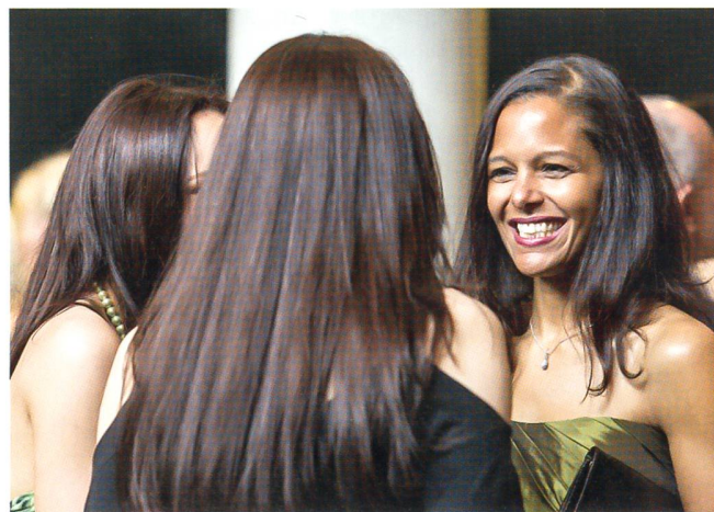
Feststimmung in der Salle de la Marive in Yverdon.