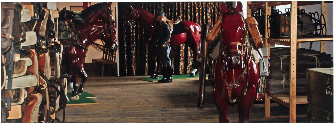
Blick in die Aarauer Ausstellung zur Geschichte der Schweizer Kavallerie. Die Ausstellung wird nun permanent geöffnet.