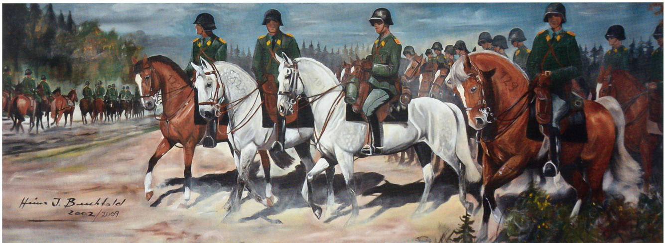
Das waren noch Zeiten. Nach heftigem Widerstand der Dragoner wurde die Schweizer Kavallerie 1972 aufgehoben.