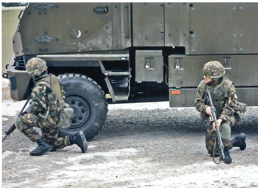
Zwei Durchdiener vor dem GMTF Duro IIIP. Die Mowag trägt die Gesamtverantwortung für die Lieferung der Fahrzeuge. Die Waffenstation RWS Kongsberg der Kongsberg Defence & Aerospace AS, Norwegen, wird der MOWAG zur Integration übergeben.

Die Beschaffung von zusätzlichen 130 GMTF trägt dazu bei, mehr Infanteriebataillone auszurüsten: «Sie öffnet zudem die Option, den anstehenden Ersatz anderer