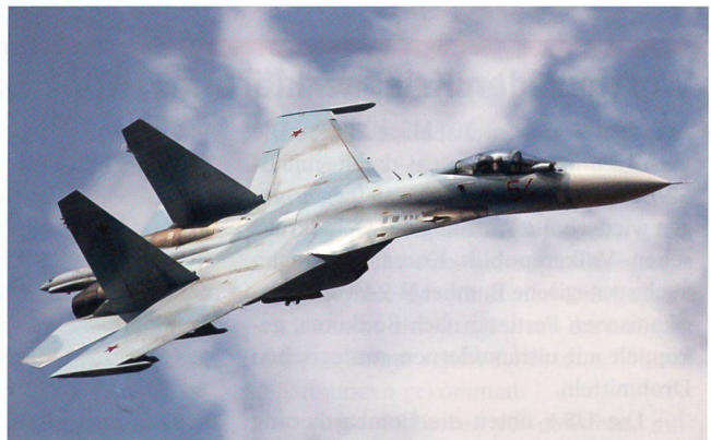
Der russische Suchoi-27, den China anfänglich in Lizenz baute. Gleicht ihm der chinesische J-10? Vergleichen Sie selbst!