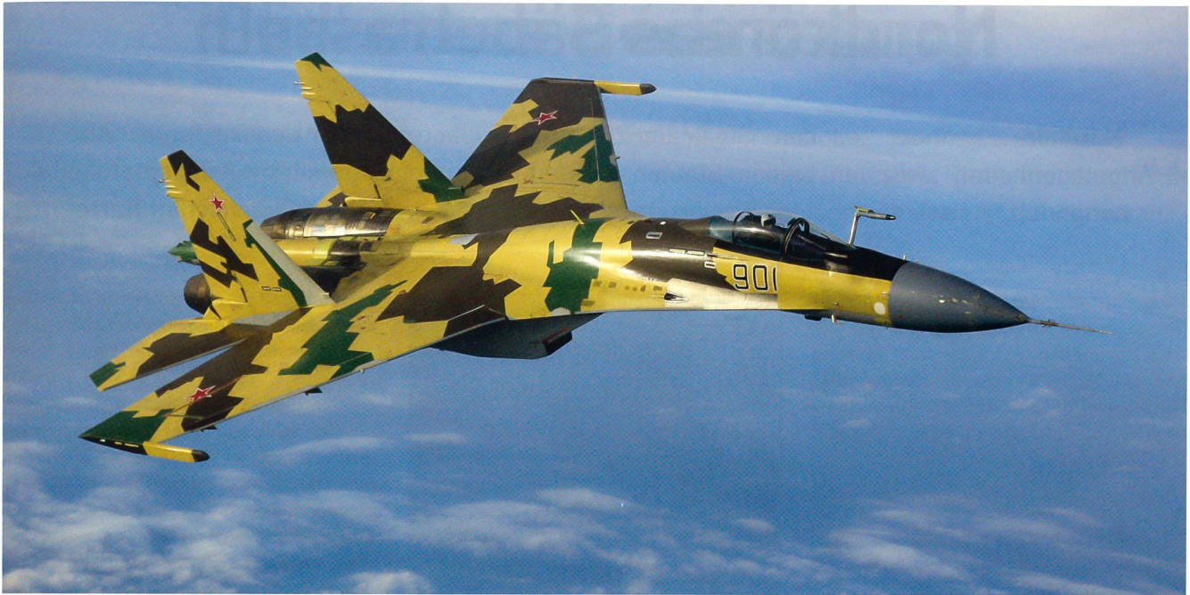
Das leistungsfähige russische Kampfflugzeug Suchoi-35 gehört zu den fortgeschrittenen Typen der vierten Generation. Der abgebildete Suchoi-35 will bald einmal in der Luft auftanken, der Refillstutzen ist ausgefahren.

von Erfahrungen in der Vergangenheit befürchtete, seine Technologien verlieren zu können.