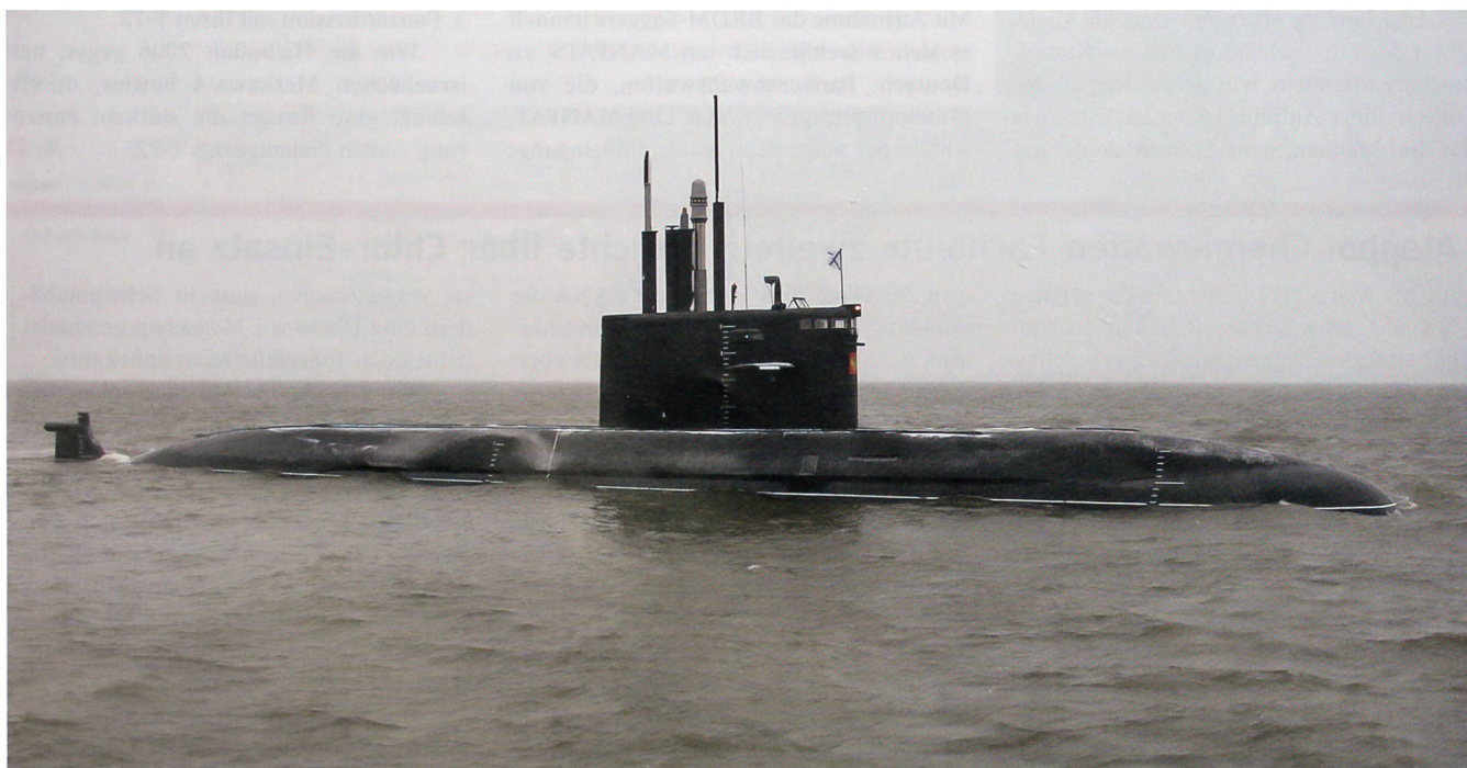
Ein russisches Unterseeboot der Lada-Klasse. Russland liefert an China gemäss chinesischer Ankündigung vier solche U-Boote.

Bis jetzt hat Russland keine Su-35 ins Ausland exportiert. Die Verhandlungen dauerten lange, weil Russland aufgrund