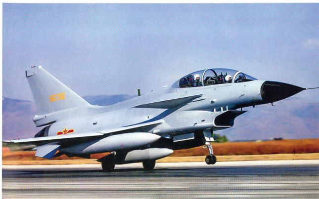
Das chinesische Kampfflugzeug J-10. Russland warf China vor, die chinesischen Ingenieure hätten den Suchoi-27 kopiert.