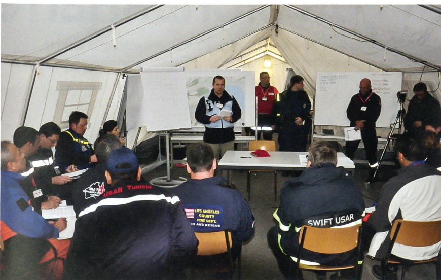
Im OSOCC-Zelt (On-site Operations Coordination Center, Koordinationszentrum).

vornehmen. Anschliessend erfolgte die gestaffelte Verschiebung in der Luft und auf der Strasse ins Einsatzgebiet in Kriens.