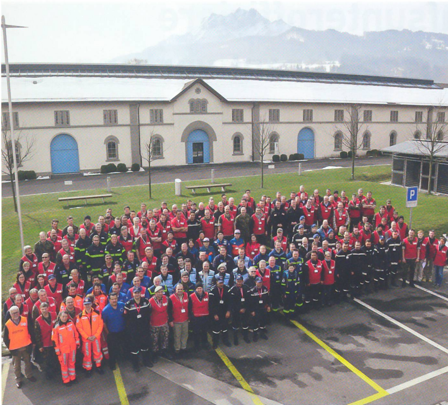
Teilnehmer und Übungsleitung in der Generalstabsschule Kriens mit dem Pilatus.

Teams traten am anderen Morgen früh den Heimweg rund um den Globus wieder an.