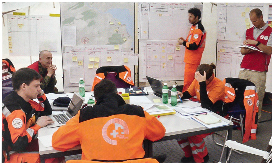
Das Schweizer Team mit den beiden Coaches (rote Westen) an der Führungswand.