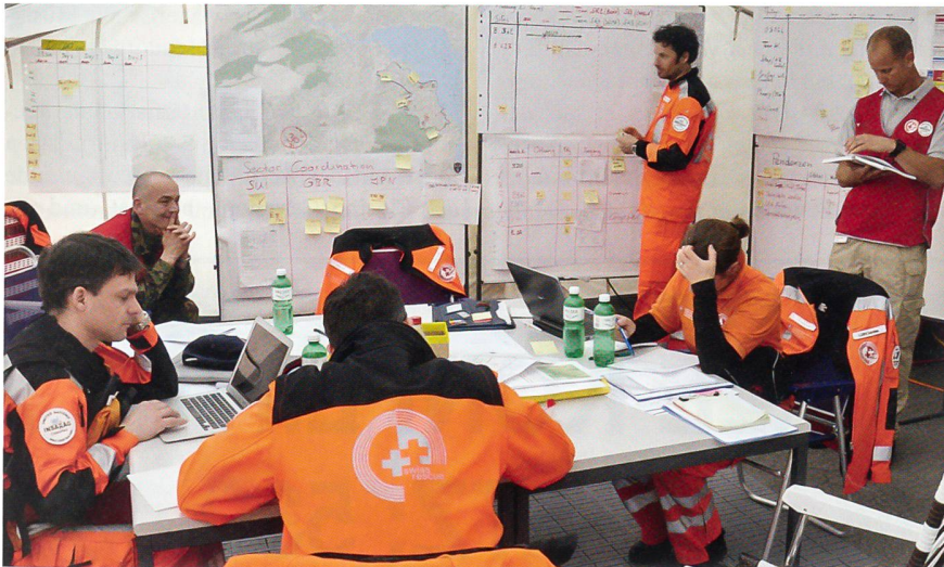
Das Schweizer Team mit den beiden Coaches (rote Westen) an der Führungswand.