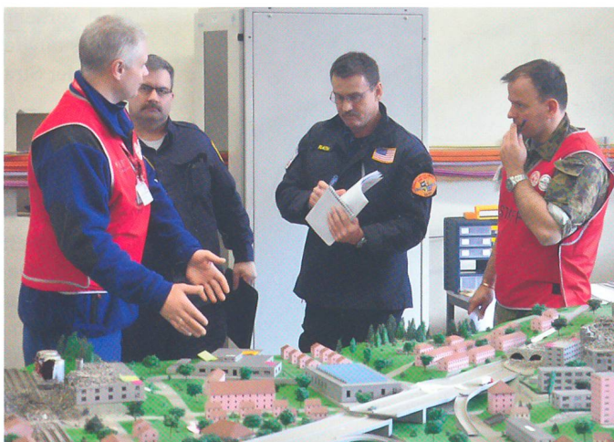
Ein Teil des amerikanischen Teams bespricht mit den Coaches die kurze Entschlussfassungsübung am Geländemodell.

Der interkulturelle Austausch nimmt anlässlich einer solchen Übung einen sehr