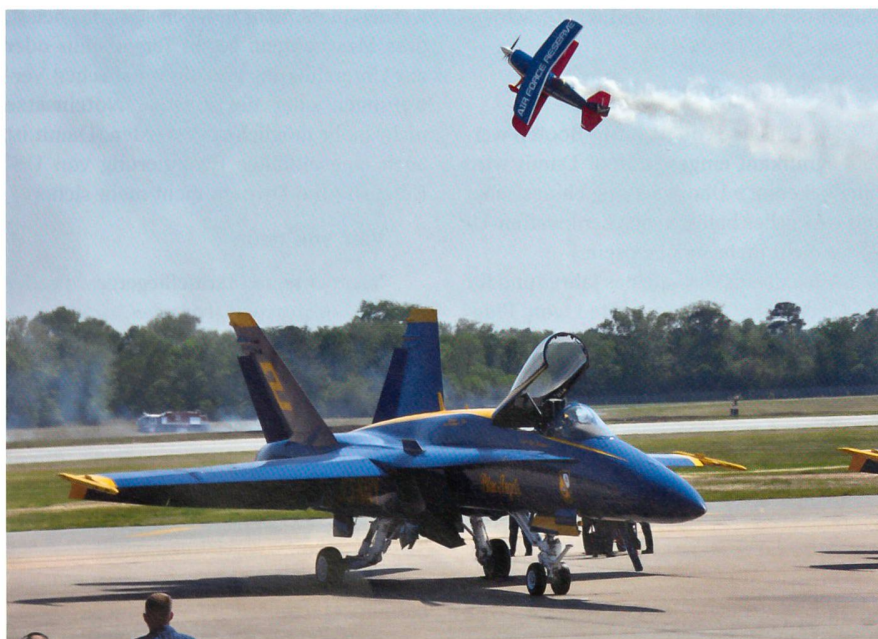
Auch das weltberühmte Kunstflugteam der US Navy, die Blue Angels (hier die Nr.-2-Maschine bei einer Flugvorführung auf der Seymour-Johnson AFB), muss vorerst seine Demonstrationen einstellen.

Es wird viel Überzeugungskraft seitens der politischen und militärischen Führung und viel Zeit brauchen, um die Angehöri-