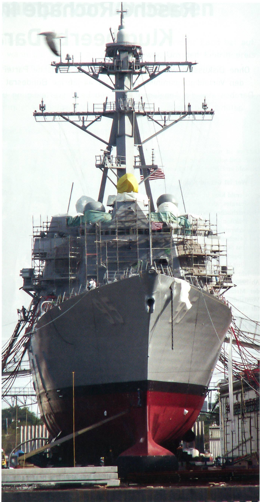
Massiv bedroht sind auch Arbeitsplätze in den zahlreichen Werften der USA, wie hier der Metro Machine Corporation in Norfolk, Virginia, mit dem Raketenzerstörer USS James E. Williams (DDG 95) im Schwimmdock.