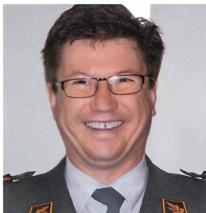
... gut gelaunt ...