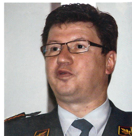
... und beschwörend.