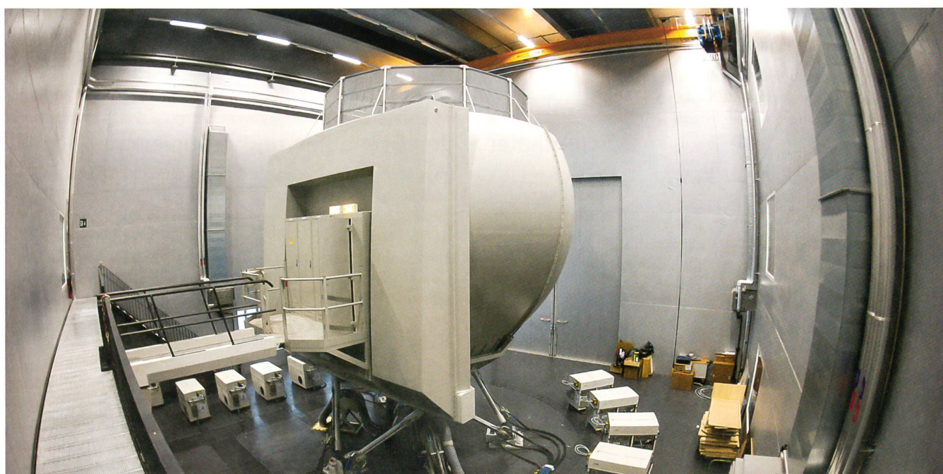
In Emmen eröffnete die Luftwaffe das neue Training Center. Das Bild zeigt den wuchtigen Simulator EC635.