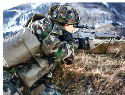
Geb Inf Bat 77: