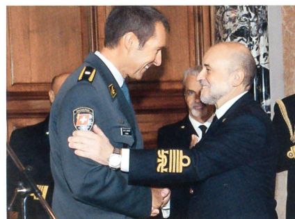
Wanner mit dem designierten Generalstabschef, Ammiraglio Binelli Mantelli.

Im Laufe des Jahres haben wir mit Freude an den Exkursionen und Aktivitäten teilnehmen dürfen, die für uns wahre