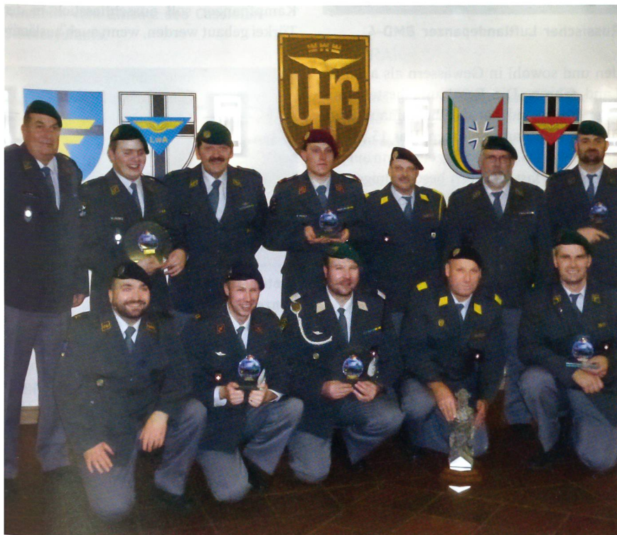
Die erfolgreiche Mannschaft des UOV Interlaken.