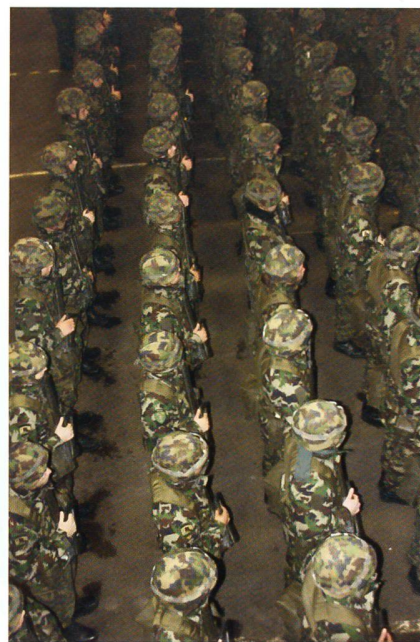
Ein Bataillon von oben: Das FU Bat 5.