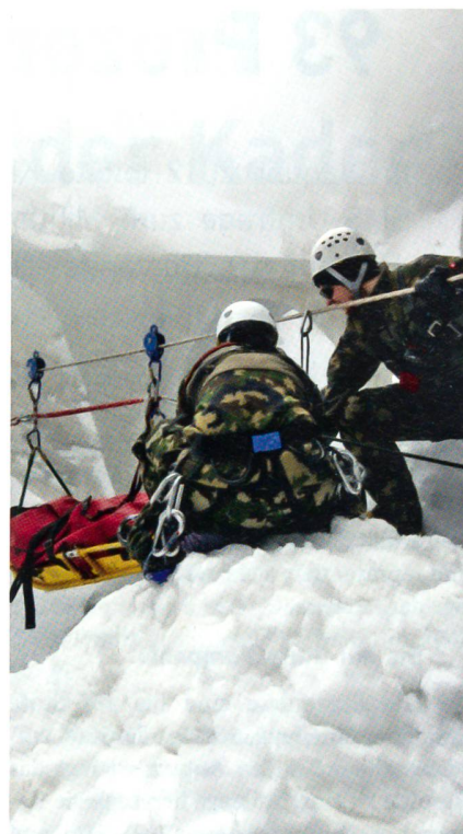
Der Gebirgsdienst in den Alpen stellt stets hohe Anforderungen.