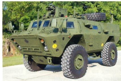
Textron TAPV der kanadischen Streitkräfte.

Textron wird bereits im Januar 2014 mit der Serienproduktion beginnen. Das kanadische Heer hatte 2012 für 440 Millionen Euro 500 TAPV (plus optionaler 100