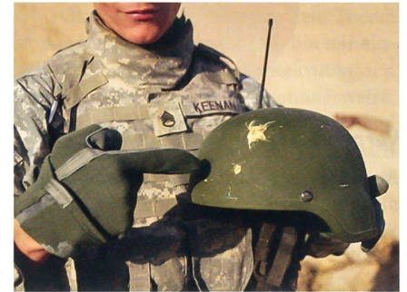
Neuer Helm «ECH» für die US-Marines.

Die US-Marineinfanterie führt ab sofort einen neuen Schutzhelm für Infanteristen ein. Der als Enhanced Combat Helmet oder ECH bezeichnete Helm bietet gesteigerten