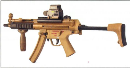
Neue Variante der H&K MP5.

Der schwäbische Waffenhersteller Heckler & Koch hat eine neue Variante seines wohl berühmtesten Produktes vorgestellt: Die MP5 Midlife Improvement. Die MP5 MLI zeichnet sich durch eine längenverstellbare Schulterstütze mit drei Rastpositionen, einen neuen «Slim Line»-Handschutz mit modularen Mil-Std 1913 («Picatinny»)-