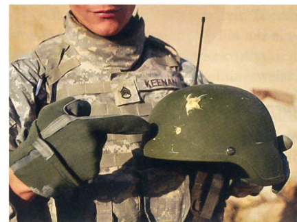
Neuer Helm «ECH» für die US-Marines.

Die US-Marineinfanterie führt ab sofort einen neuen Schutzhelm für Infanteristen ein. Der als Enhanced Combat Helmet oder ECH bezeichnete Helm bietet gesteigerten