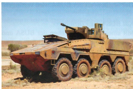
GTK Boxer mit Geschützturm.

Das in der Variante Fahrschulfahrzeug produzierte Fahrzeug ist der erste Boxer für die Niederlande, die insgesamt 200 Stück in den Varianten schweres geschütztes Sani-