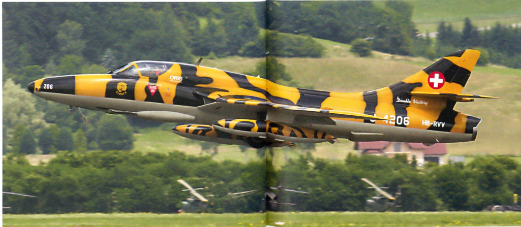
Der im Tigerlook bemalte Schweizer Hunter vom Fliegermuseum Altenrhein beim Start zur Vorführung.