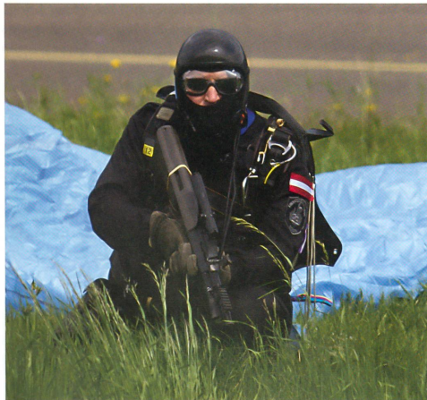
Ein Mitglied des Sonderkommandos Cobra geht in Stellung.