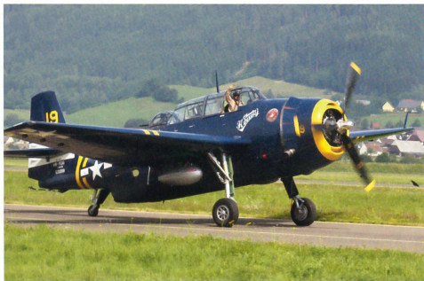
TBM-3E Avenger rollt zum Start.