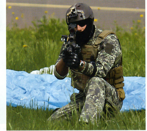
Ein Soldat des Jagdkommandos sichert ab.