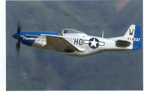
Oldtimerlegende P-51 Mustang bei der Vorführung.