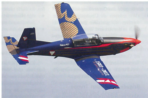
Österreichische PC-7 mit Sonderanstrich zum 30-Jahr-Jubiläum.