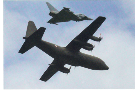
Eine C-130 Hercules wird von einem Eurofighter begleitet.