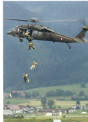
Black Hawk S-70 und Jagdkommando.