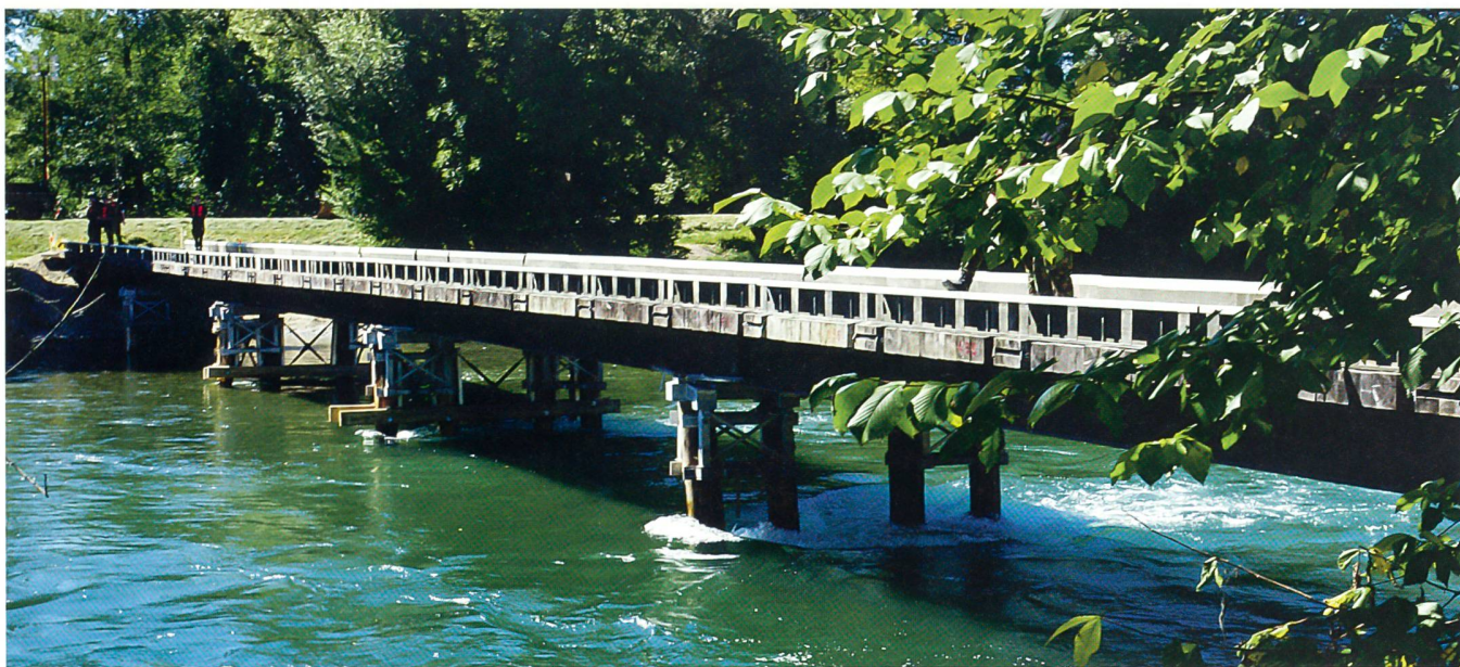
70 Meter lange Brücke über die Reuss bei Obfelden.