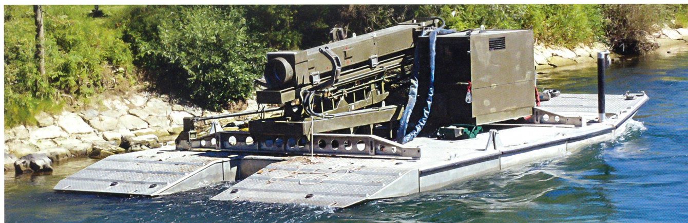
Schwimmramme der Armee.

hölzerne Balkenplatten auf die Stahlträger versetzt und verschraubt. Rund 100 Mann brauchten dafür 24 Stunden. Die Kp könnte mit dem Vollbestand von 180 Mann die Brücke über längere Zeit betreiben.