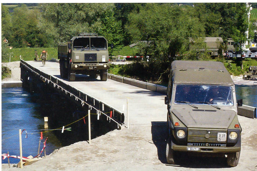
Erste Fahrzeuge passieren die Brücke.