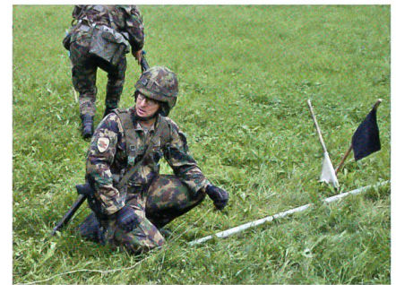
Stabsadj Gloor mit dem drei Meter langen Sprengrohr und der Schnur.