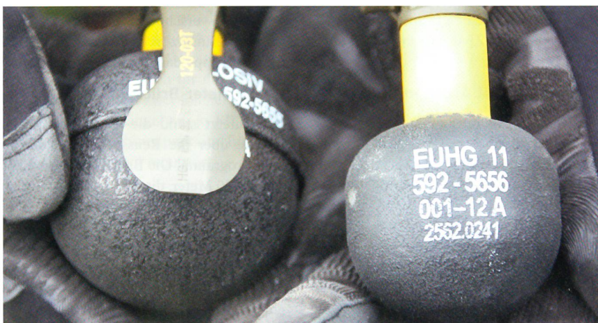
Links die schwerere, grössere EUHG 85; rechts für den urbanen Kampf die EUHG 11.

Jeder kennt die Explosivübungshandgranate 85 (EUHG 85). Sie wiegt 465 Gramm und enthält 155 Gramm Sprengstoff.