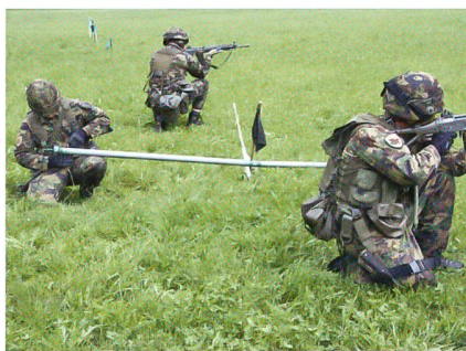
Die Fahnen bezeichnen das Ziel. Gloor macht das Rohr zur Explosion bereit.