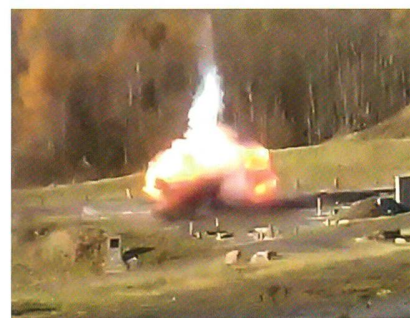
Ingolstadt: Die Stichflamme geht hoch.