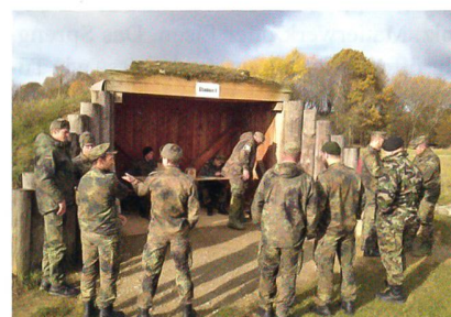
Ausgabe der Sprengmittel (Station 1).