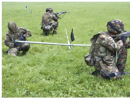
Die Fahnen bezeichnen das Ziel. Gloor macht das Rohr zur Explosion bereit.