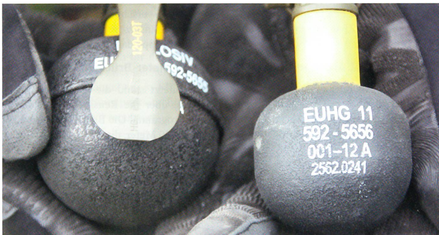
Links die schwerere, grössere EUHG 85; rechts für den urbanen Kampf die EUHG 11.

Jeder kennt die Explosivübungshandgranate 85 (EUHG 85). Sie wiegt 465 Gramm und enthält 155 Gramm Sprengstoff.