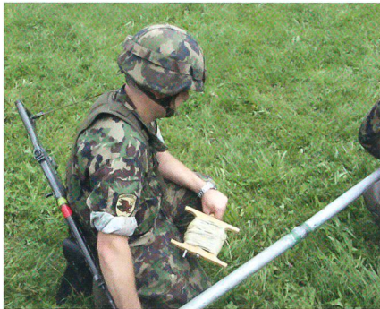
Hptadj Hösli mit der Verlängerungsschnur zum Zünden des Sprengrohrs.

Dann schlägt er den beiden Sicherungselementen kurz auf den Rücken – zum Zeichen: «Alles vorbereitet, wir kön-