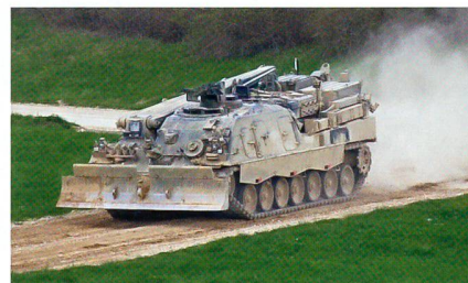
Der Bergepanzer Büffel rollt heran.