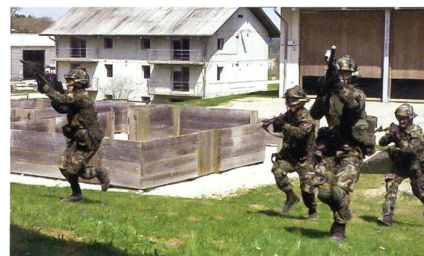
Im Häuser- und Ortskampfdorf Nalé.