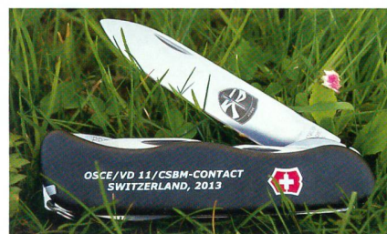
Das Souvenir vom OSZE-Besuch.