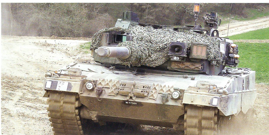
In Bure erhielt das Panzerbataillon 14 von der OSZE das Prädikat «sehr gut».

Danach erhielten die Besucher die Gelegenheit, den Angriff einer Panzerkompanie im Gelände zu beobachten, inklusive