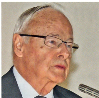
KKdt Heinz Häsler.