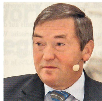
Nationalrat Jakob Büchler.