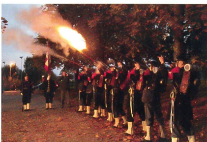
Miliz-Compagnie 1861: «Feuer frei!»

Es müsse in der Armee nun mit Hochdruck dort korrigiert werden, wo dringender Handlungsbedarf bestehe. Die Armee muss