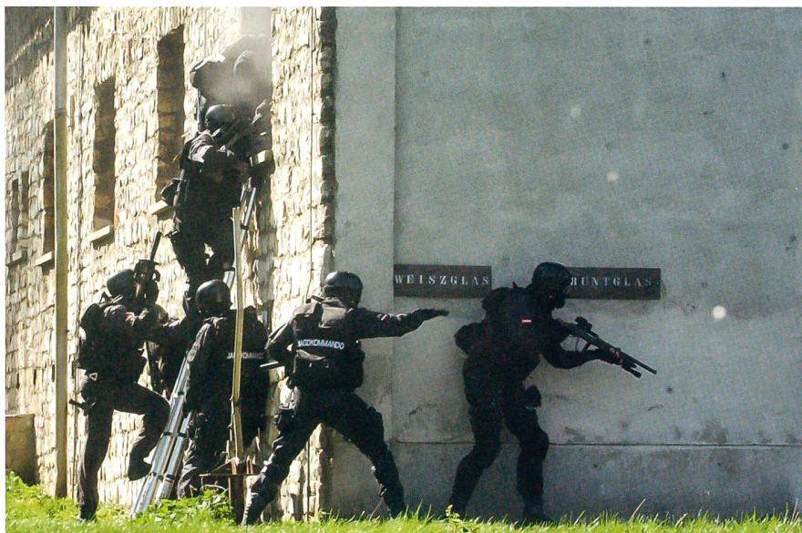
Das österreichische Jagdkommando beim entschlossenen Zugriff.

Hintergrund dieser starken Anlehnung war der Umstand, dass 1958 und somit zwei Jahre nach der Aufstellung des Bundesheeres der Zweiten Republik zwei Offiziere der Infanteriekampfschule an der Special Warfare School in Fort Bragg, North Carolina, die Luftlandeausbildung bei der 82. US-Infanteriedivision durchliefen und 1961 erneut Offiziere in den USA den Special