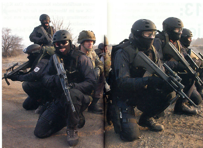
Die Evakuierung von wichtigen Personen gehört zu den Kernaufgaben des Jagdkommandos.