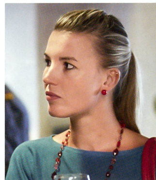
Diana Gutjahr, VR E. Fischer AG, Stahl- und Metallbau.