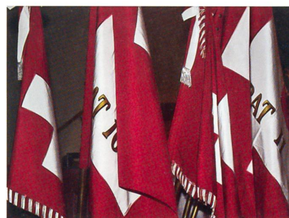
Feldzeichen: Symbol der Armee und des Verbandes als Schicksalsgemeinschaft.

Dagegen muss die Armee konsequenter vorgehen und entsprechende Massnahmen einleiten, wie beispielsweise die Einführung eines etwas detaillierteren und auf die heutigen Sozialmedien ausgerichteten Verhaltenskodex beim Tragen der Uniform.