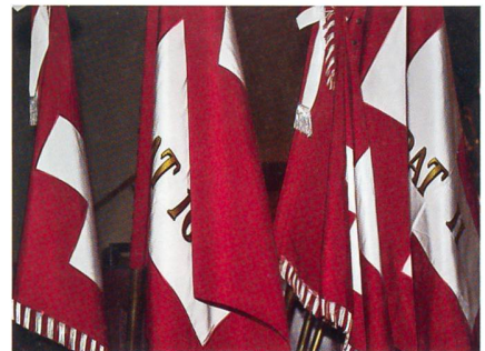
Feldzeichen: Symbol der Armee und des Verbandes als Schicksalsgemeinschaft.

Dagegen muss die Armee konsequenter vorgehen und entsprechende Massnahmen einleiten, wie beispielsweise die Einführung eines etwas detaillierteren und auf die heutigen Sozialmedien ausgerichteten Verhaltenskodex beim Tragen der Uniform.