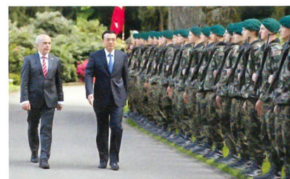
Mit 36 zu 1 Stimme lehnte der Ständerat die Motion Minder ab, welche die Abschaffung der Ehrengarde verlangte.

Der Neuenburger Sozialdemokrat Berberat und der Zürcher Freisinnige Gutzwiler hielten Minder vor, ausgerechnet er bringe eine völlig unnötige, ja leicht lächerliche Motion ein.