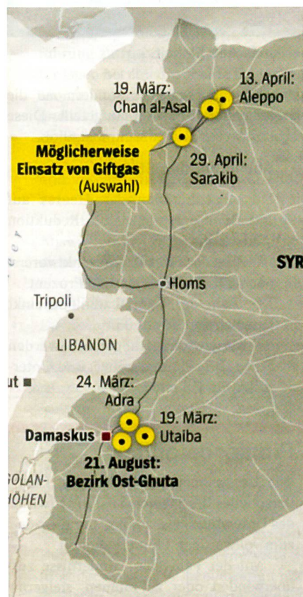
Schwerpunkte: Aleppo und Damaskus.