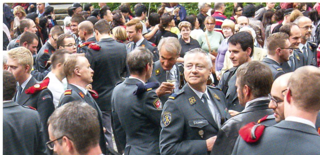
Der Schulterschluss ist vollzogen: Artillerie und Luftwaffe.