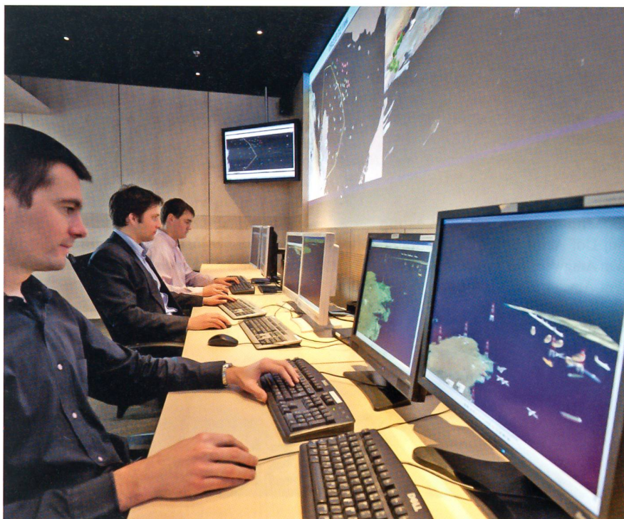
Die Mitarbeitenden im System Design Centre simulieren Projekte mit Computern und verhindern, dass Fehler oder Unzulänglichkeiten nicht rechtzeitig festgestellt werden.

Die Kernelemente des Vorgehens bei der Integration von grossen und komplexen Systemen sind: die Planung und Steuerung des Prozesses, das Systemengineering, das Design, die Inbetriebnahme, der Betrieb, der Service und das Training. Die Merkmale von ITK-Projekten sind die Anzahl verschiedener Systeme und Komponenten, die Komplexität der Anforderungen der