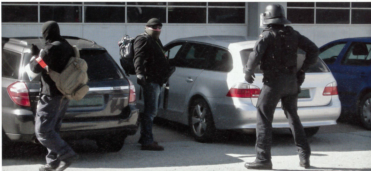
Auch das gehört zur sicheren Schweiz: Der Zugriff des Militärpolizei-Spezialdetachementes gegen Waffenschieber auf dem Ceneri.