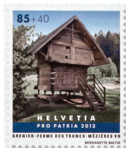
Die Ferme des Troncs in Mézières/VD.

Ein stark beanspruchter Fonds ist derjenige für «Schweizer Kleinbauten». In den vergangenen Jahren wurden rund 400 sorgfältig ausgewählte Gesuche bewilligt und über