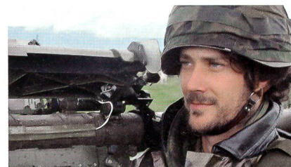
Lehrverband Flab 33: Volltruppenübung CHESS TRIO mit Kanone, Stinger und Rapier