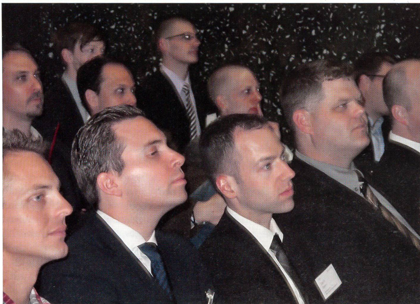
Studenten und Absolventen der Uni St. Gallen bei einem Vortrag des Armeechefs.