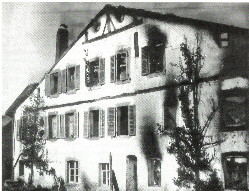
Das Brandobjekt West im zerstörten Zustand (historische Schwarz-Weiss-Aufnahme).

Von entfernten Fliegerbeobachtungsposten wurde gemeldet, dass acht Thunderbolts die CH-Grenze bei Sommétres überflo-