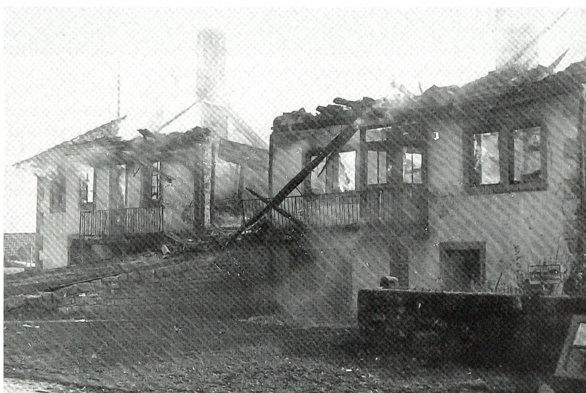
Das Brandobjekt Ost in ausgebranntem Zustand – nur die Grundmauer stand noch.

gen und sich in zwei Doppelpatrouillen aufgeteilt hätten. Zwei Flugzeuge der einen Formation führten den Angriff aus Nordnordost auf Le Noirmont aus, indem sie im Tiefflug auf 30 m über Grund und bei einer Geschwindigkeit von gut 500 km/h ihre Ziele anvisierten und beschossen. Der ganze Angriff dauerte höchstens 20 Sekunden.