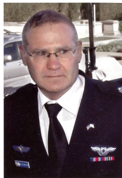
Amos Yadlin mit dem Fallschirm- und dem Pilotenabzeichen. Sichtbar die Ribbons für den Jom-Kippur-Krieg (1973) und den Libanon-Feldzug (1982). Yadlin flog 250 Kampfmissionen und hat 5000 Flugstunden. Er war Attaché in Washington und Chef des militärischen Nachrichtendienstes. Von der Negev-Uni hat er den Bachelor in Wirtschafts-, von Harvard den Master in Staatswissenschaft.

Daher haben sie mehr Zeit, festzulegen, wann der Moment der Entscheidung gekommen ist. Was wir brauchen, ist eine klare Zusicherung, dass im Falle eines israelischen Zuwartens und des Scheiterns aller Bemühungen, Teheran vom Atomkurs