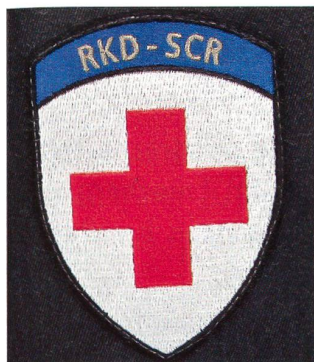
Der Badge, den die Angehörigen des Rotkreuzdienstes auf dem rechten Oberarm tragen.