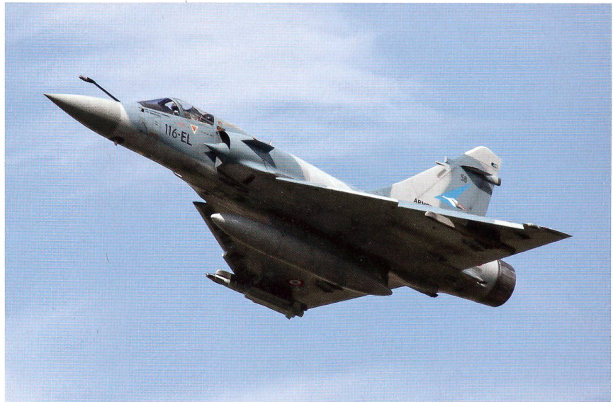
Start Mirage 2000: Das Jagdgeschwader 1/2 in Payerne.