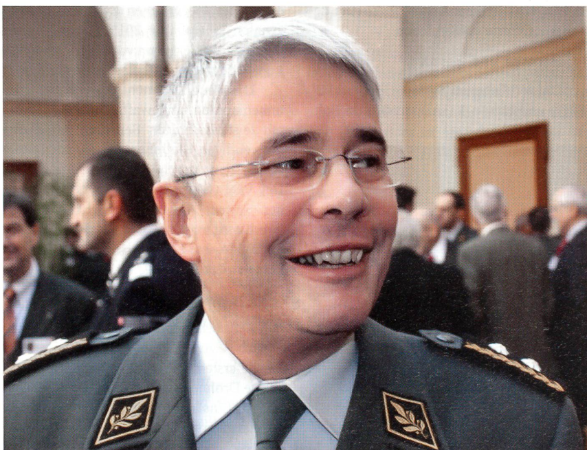
Divisionär Andreas Bölsterli ist der Ansprechpartner der Kantonsregierungen.

Hanspeter Gass ist Regierungsrat des Kantons Basel-Stadt und Präsident der Regierungsrätlichen Konferenz Ter Reg 2.