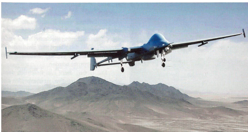
Das Konkurrenzprodukt von Israel Aircraft industries, die Drohne Heron 1.