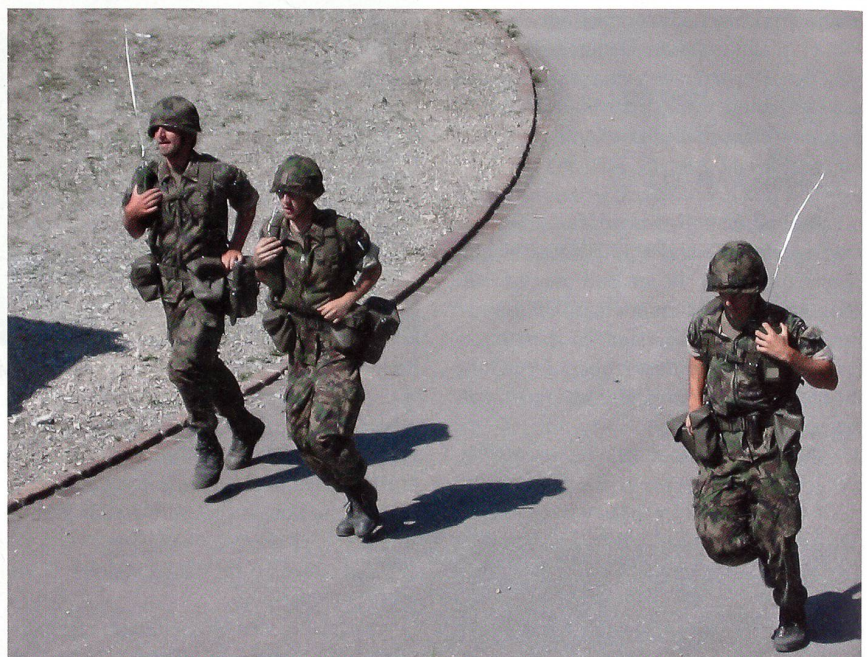
Schweizer Rettungstruppen in einem früheren Einsatz in Bernhardzell.

Dort kommt es als Folge eines Erdbebens zu einem Hauseinsturz; ein Hundesuchtrupp der Schweizer Armee unterstützt die österreichischen und deutschen Hilfskräfte bei der Suche nach Vermissten.