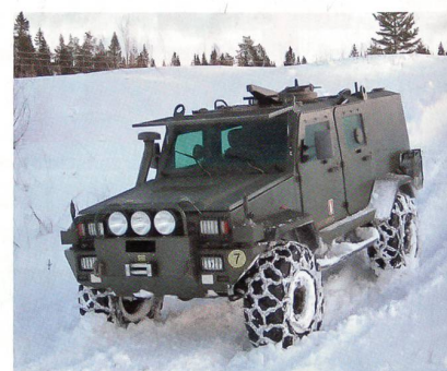
Schwedisches Patrouillenfahrzeug RG32M im Schnee.