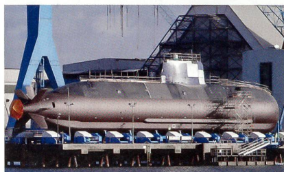
Modernes U-Boot des Typs Dolphin mit Torbuster-Schutzsystem.

Israels U-Boote der DOLPHIN-Klasse sind die weltweit ersten U-Boote, welche mit einem aktiven Schutzsystem gegen Torpedos, vergleichbar mit den Systemen auf gepanzerten Fahrzeugen, ausgerüstet werden. Das von der Firma Rafael entwickelte «Hard-Kill-Torpedo-Defence-System» hat