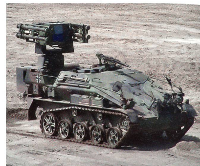
Leichtes Flugabwehr System (LeFlaSys) Ozelot.

Seit den 90er-Jahren wurde der Umfang der Truppe stetig reduziert. Standorte wurden geschlossen und bis 2010 die beiden Hauptwaffensysteme, das Flugabwehraketensystem Roland und der Flugabwehrkanonenpanzer Gepard, ausser Dienst gestellt. Verblieben ist das 2001 eingeführte Leichte Flugabwehr System (LeFlaSys)