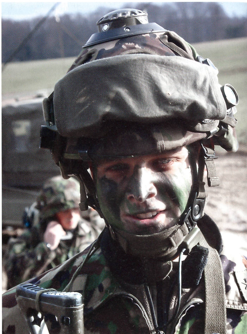
Ein Kompaniekommandant mit der Simulationsausrüstung.

Mit Videoaufnahmen werden innerhalb und ausserhalb der Gebäude Szenen festgehalten. Damit auch in der Dunkelheit geübt werden kann, sind die Innenkameras infrarotauglich und die Kameras ausserhalb der Gebäude haben eine Wärmebildfunktion. Zusätzlich stehen der Übungslei-