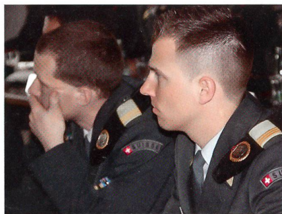
Gelb: In der Pz Br 11 eine starke Farbe.