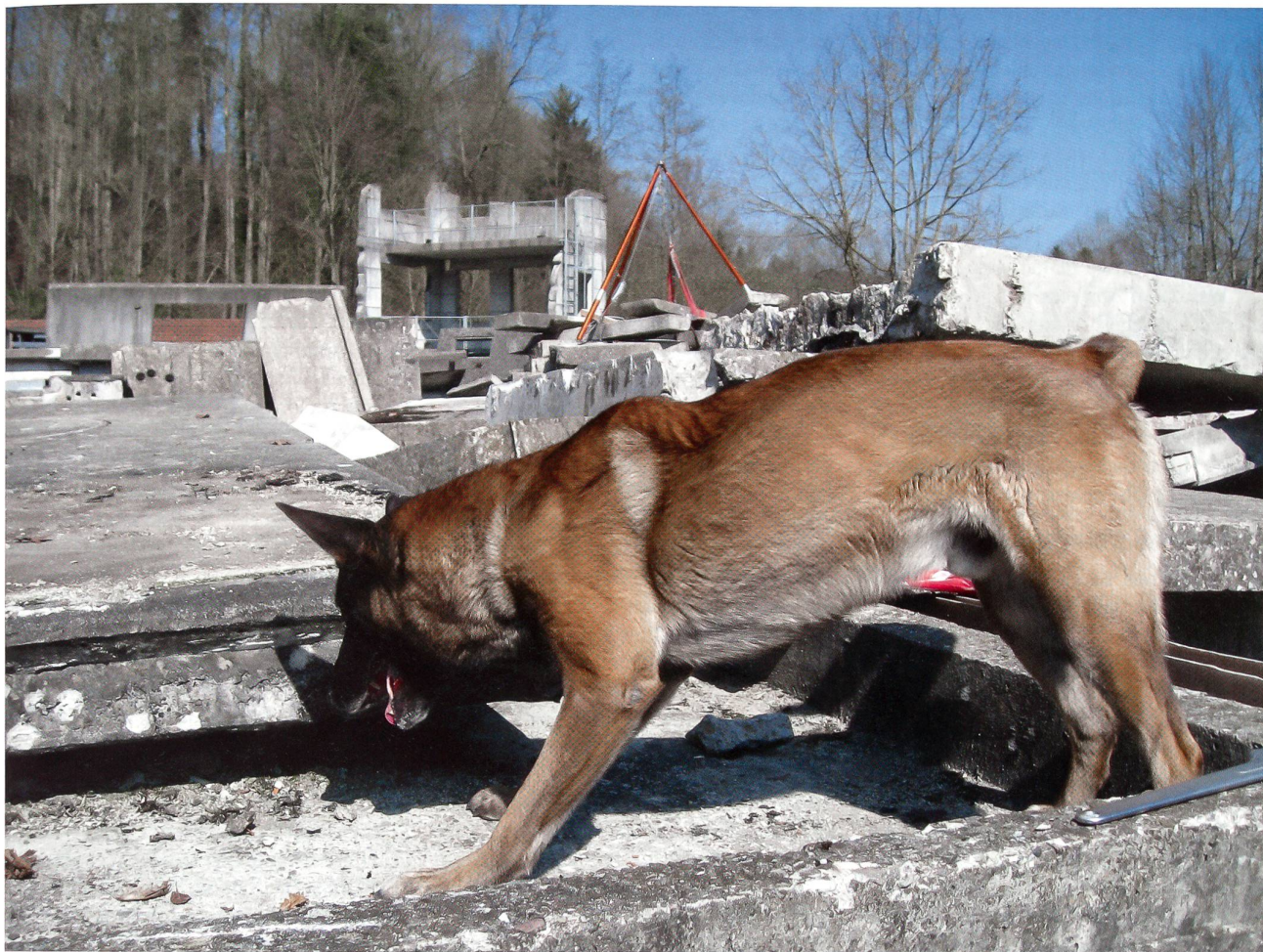
Die Bedeutung der Tiere in militärischen Belangen ist hoch einzustufen. Immer wieder leisten Tiere wertvolle Dienste.

Viele Besucher haben ihren eigenen Hund mitgebracht. So dürfen nun auch die Zivilisten unter den Hunden auf den Untersuchungstisch und sie werden kurz untersucht. So erleben die Gäste, was alles regelmässig kontrolliert wird.