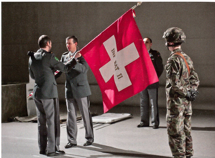
Infanteriebrigade 5: Feierliche Übergabe eines Feldzeichens.

wartungen unserer Partner vollauf entsprachen; den Kadern gebührt mein Dank und Respekt.