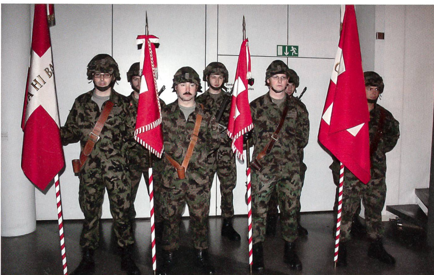
Standarten als starke Symbole bei würdigen Anlässen.