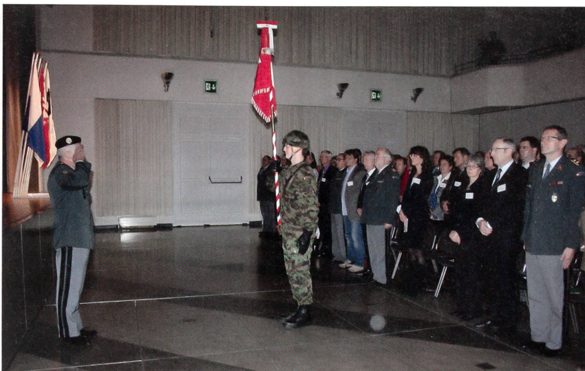
Bereit zum Rapport.