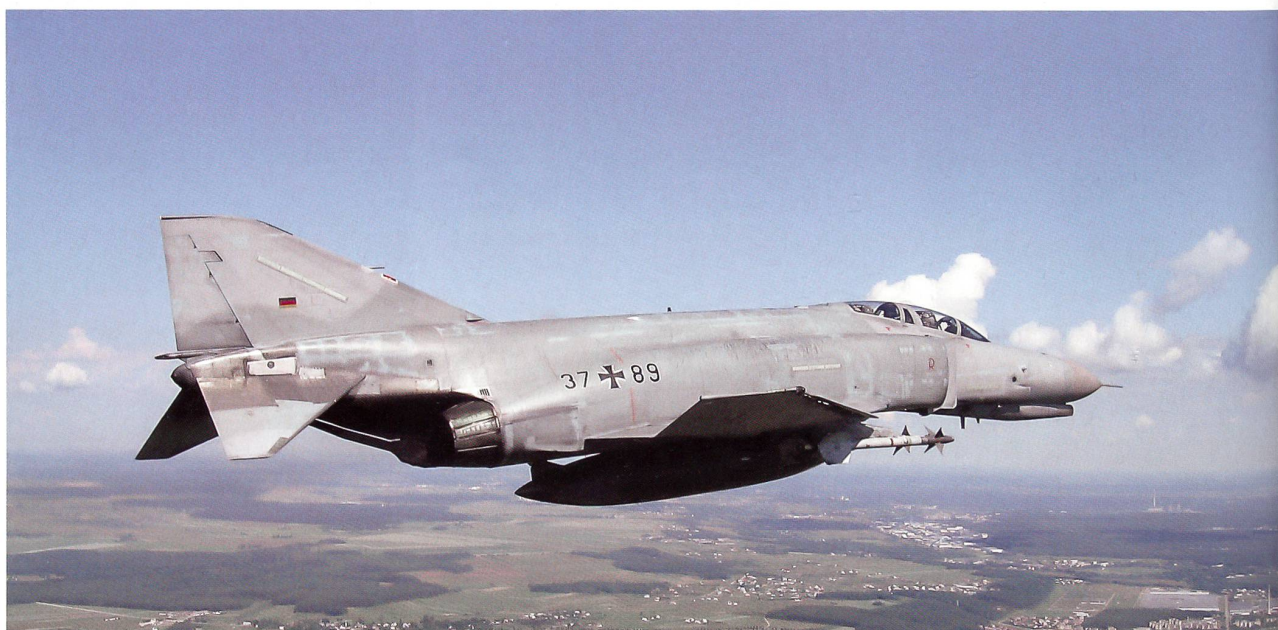
Mit dem vielfach bewährten F-4 Phantom, einem «alten Schlachtross», schützt die deutsche Luftwaffe den baltischen Luftraum.