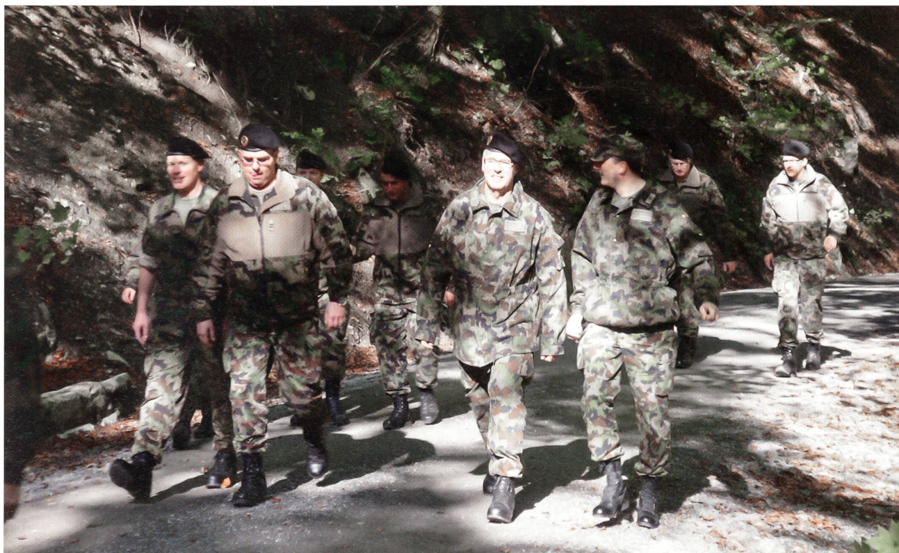
Rapport einmal anders: Den Rapportteilnehmern der FU Br 41 wurde eine zünftige Marschleistung abverlangt.