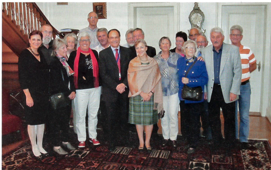
Der UOV Zürich beim Schweizer Botschafter mit Nationalrätin Doris Fiala (links).