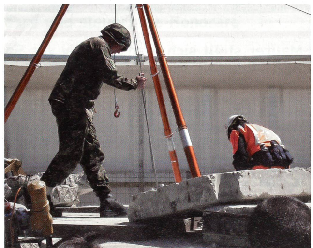
Das Dreibein ist montiert und am Haken kann die Stollenbahre mit dem Verletzten hochgezogen werden.