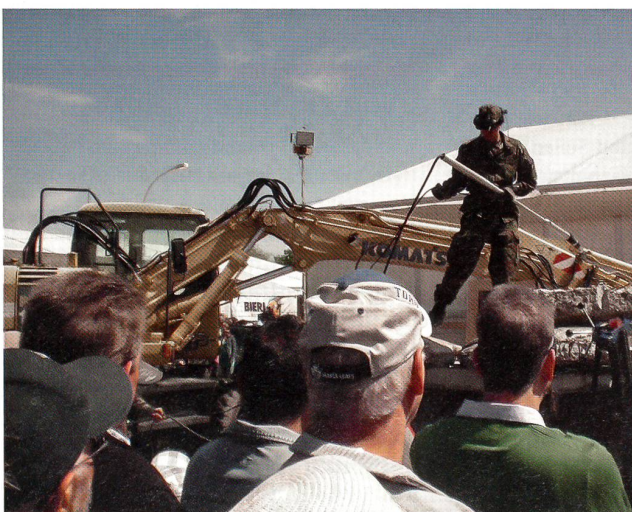
Mit der Video-Verschütteten-Such-Ausrüstung (VVSA) wird der Verschüttete geortet.