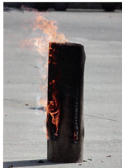
Das Feuer brennt – für eine starke, glaubwürdige Armee. Hier bei der VBA Telematik 61 in Frauenfeld.