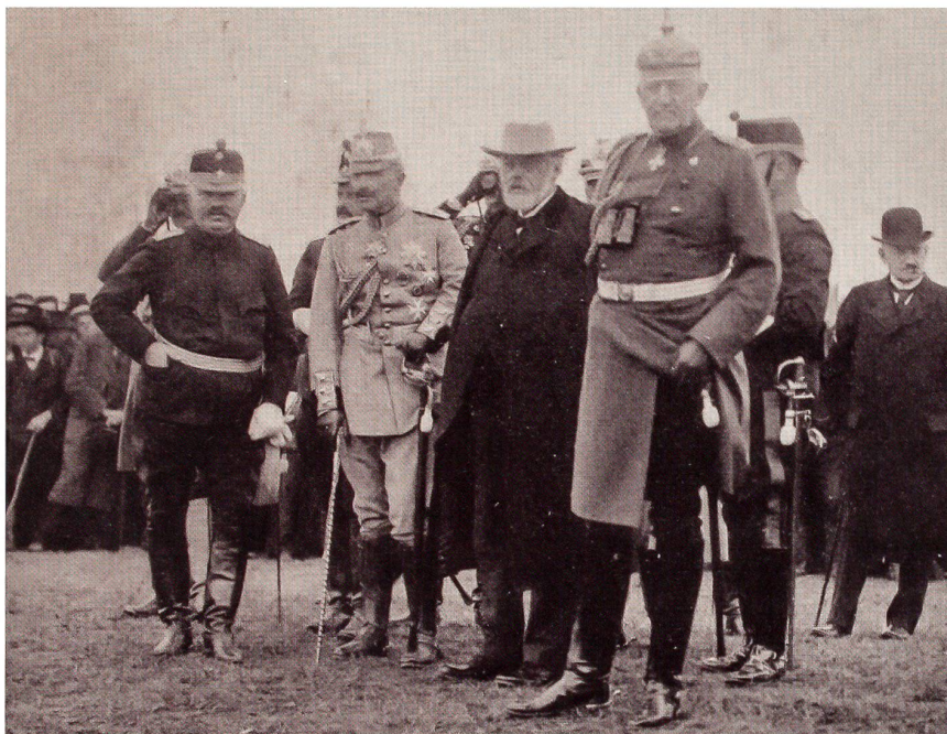
Kaiser Wilhelm II. (2. von links) beobachtet die Manöver.

Diese beschäftigt die Frage, ob im Kriegsfall französische Truppen unter Verletzung der Schweizer Neutralität nach Süd-