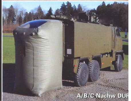
A/B/C Nachw DUF

GENERAL DYNAMICS European Land Systems-Mowag