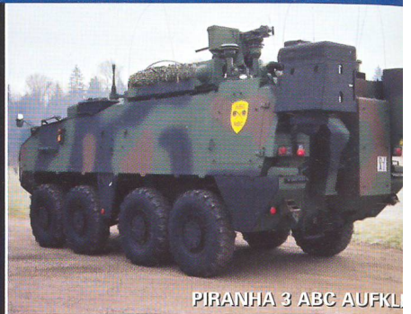
PIRANHA 3 ABC AUFK